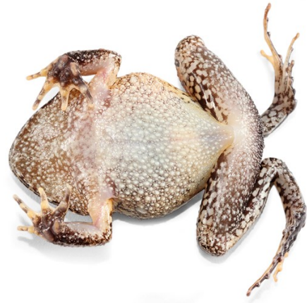
Santiago R. Ron

Strabomantis sulcatus , Cutín bocón de Nauta