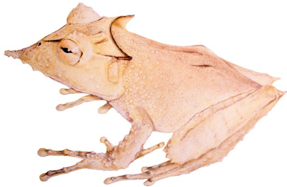
Ilustración de Rita Hidalgo