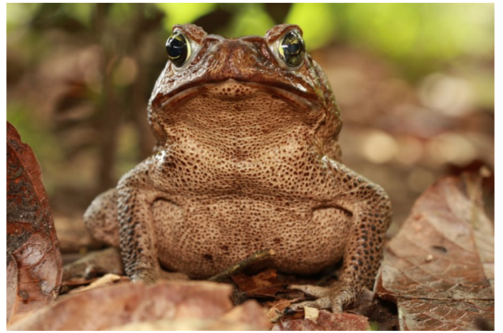
Rhinella marina , Sapo de la caña